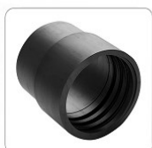
Mufa VAC A