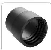
Mufa PVC Flex