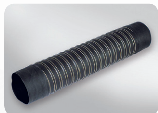
Wersja z mufami Master NEO 1 K